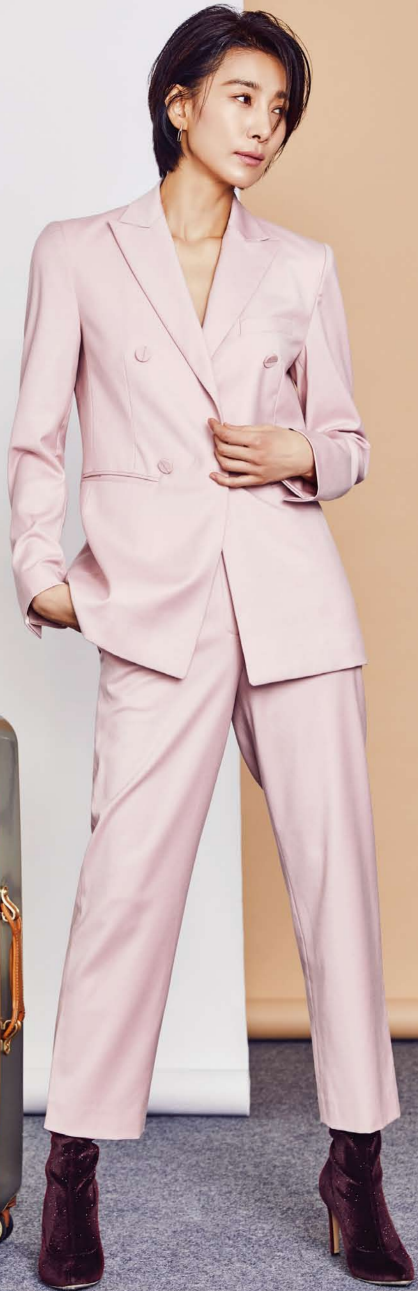
촬영 제품인 인텐시티 SPL FL 알루미늄 컬러 28인치 사이즈. 하트만.

인텐시티 SPL FL은 하트만의 대표 제품인 기존 인텐시티 SPL의 업그레이드 버전으로, 전체적인 디자인은 그대로 유지하면서 디테일을 변형해 제품의 품격을 한 단계 높였다. 모던하고 클래식한 느낌을 모두 살려 가볍지만 견고한 PC 소재 하드 케이스다. 최고급 미국 벨링레더 디테일은 하트만의 DNA를 잘 드러내며, 매력적인 메인 컬러 아우라져 한정적이고 시크한 매력을 선사한다. 촬영 제품은 인텐시티 SPL FL 알루미늄 컬러 28인치 사이즈. 하트만.